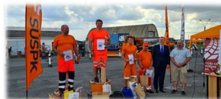
Vítězové Karlovarského kraje