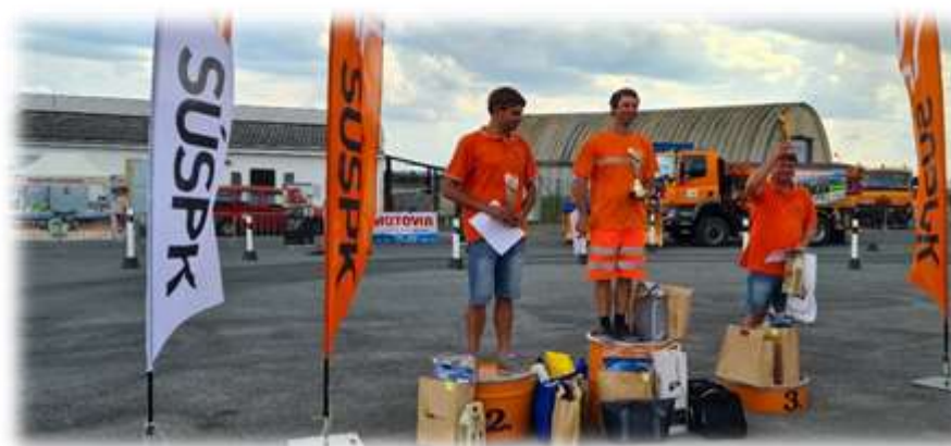
Vítězové Plzeňského kraje