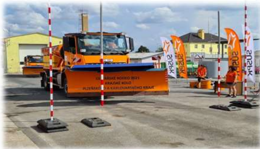
Závodní sypač na trati