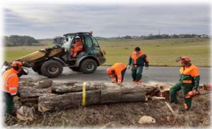
Silnice III/19841 Dolní Jadruž - kácení dodavatelsky prosinec 2021