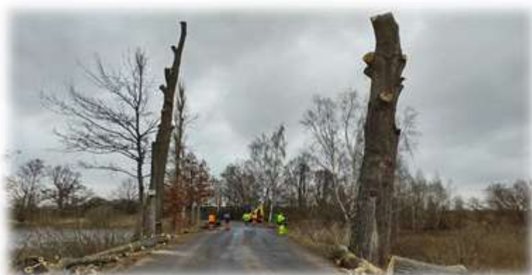
Silnice II/201 Doubravice u Nečtin - havarijní dub - kácení dodavatelsky prosinec 2021